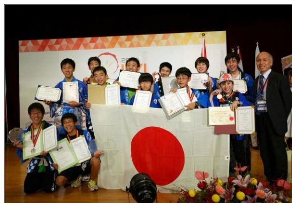
受賞後に行った日本派遣団の記念撮影