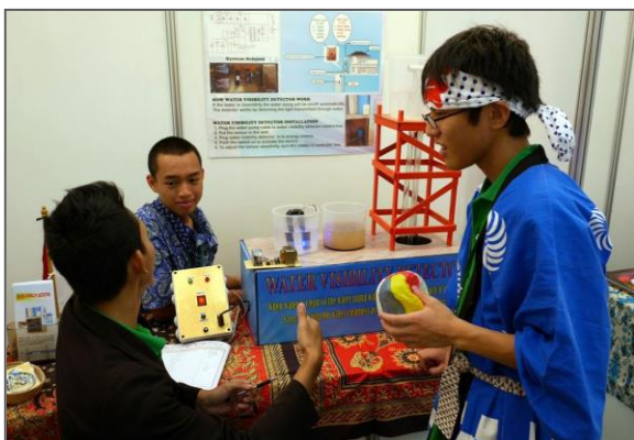
各国・地域の学生と交流する池田団員