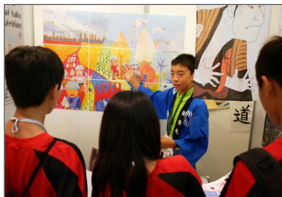
地元の学生に作品説明する相生団員