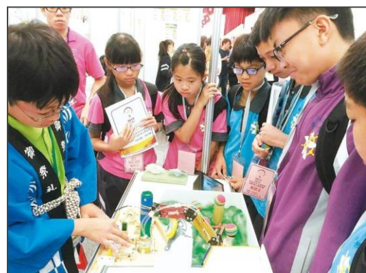
地元学生への説明に対応する海田団員